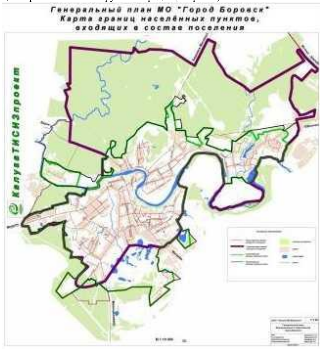
Рис.3 - Карта границ населенных пунктов, входящих в состав Поселения

Граница города Боровска совпадает с границей городского поселения МО ГП «Город Боровск», что в свою очередь предполагает развитие городской черты исходя из расчетной величины прироста населения города с учетом миграционных потоков и возвращения рабочей силы из крупных городов (см. рис. 3).