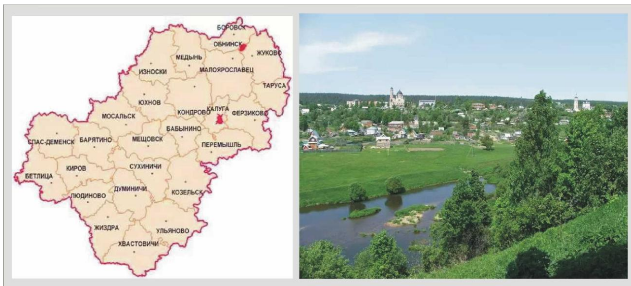
Рис.1 - Месторасположение города Боровска на территории Калужской области

Муниципальное образование городское поселение город Боровск — административно-хозяйственный и культурный центр Боровского района Калужской области. Расположен в 80 километрах к юго-западу от Москвы и в 106 километрах к северу от Калуги на обоих берегах реки Протвы, примерно в 20 км от станции Балабаново Киевского направления Московской железной дороги. Город занимает территорию около 1044 гектаров (см. рис. 1-2).